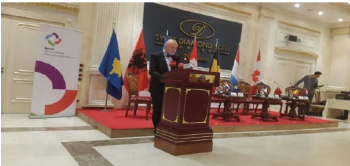
Premier Forum Francophone d'Investissement au Kosovo