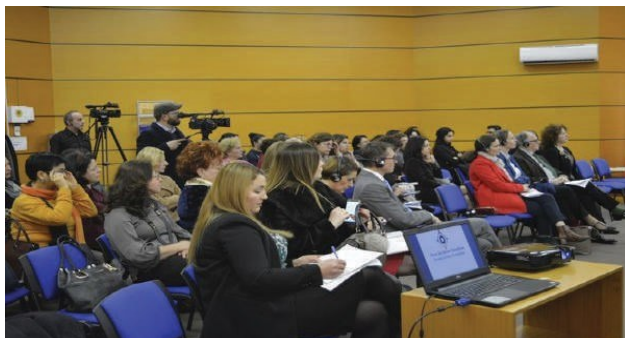
2ème Forum national des femmes albanaises francophones