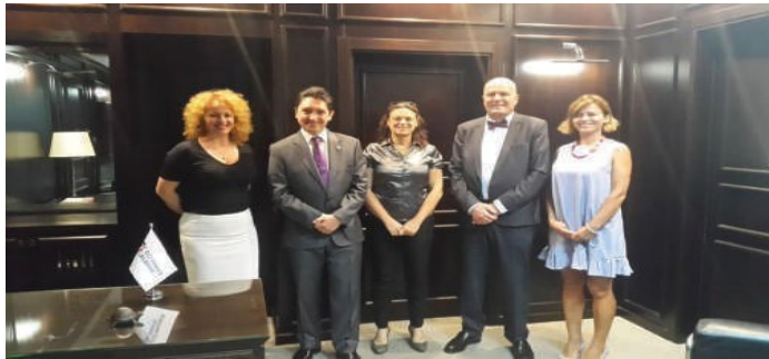
Visite à la CCIFA du sénateur Olivier Cadic