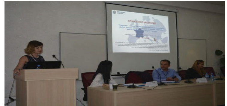
Conférence Scientifique: Assurer la Qualité Dans l'Enseignement Supérieur, Apprentissage FLE : Nouvelles Dynamiques de Recherche et d'Insertion Professionnelle»