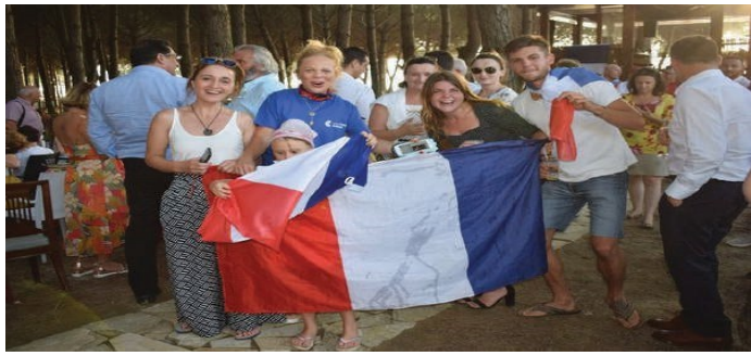
«3eme Fête de l'Eté»