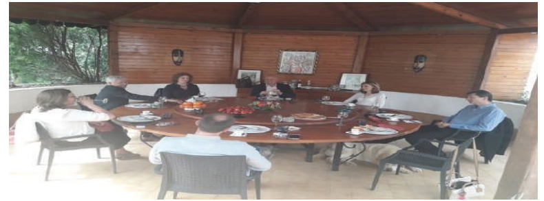
Head of the International Economics Department of Figaro visited Albania...