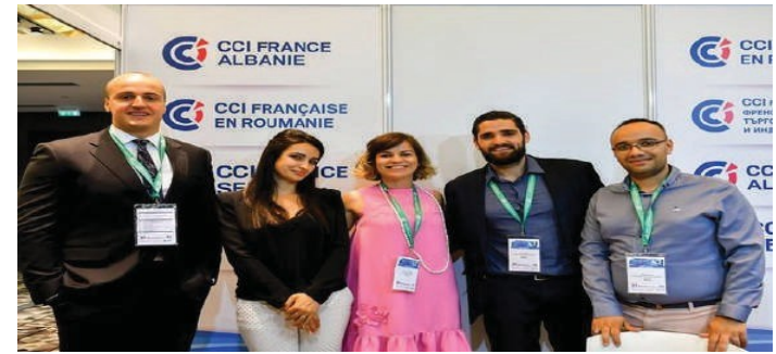
BUSINESS FORUM FRANCE - BALKANS2018