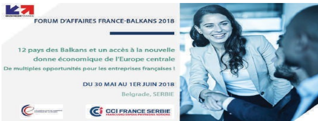
Business Forum France-Balkans