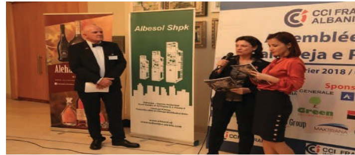
L'Assemblée Générale 2018