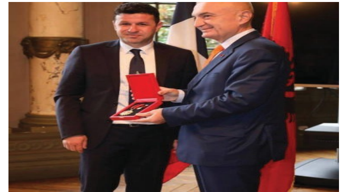
Edvin Murati honoré par le Président Ilir Meta avec le titre "Grand Maître"