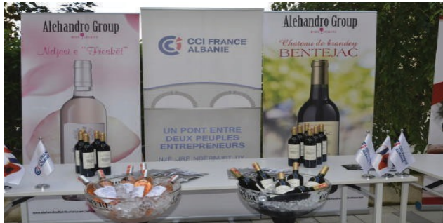
"International Tasting Wine & Spirits 2"