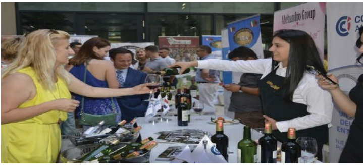
"International Tasting Wine & Spirits2"