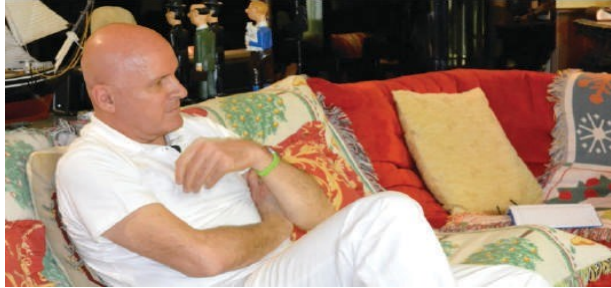
Roche's Revelations on his albanian 'adventure'