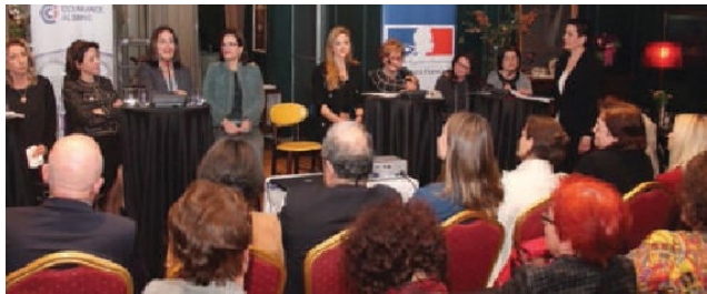
2ème Forum national des femmesalbanaises