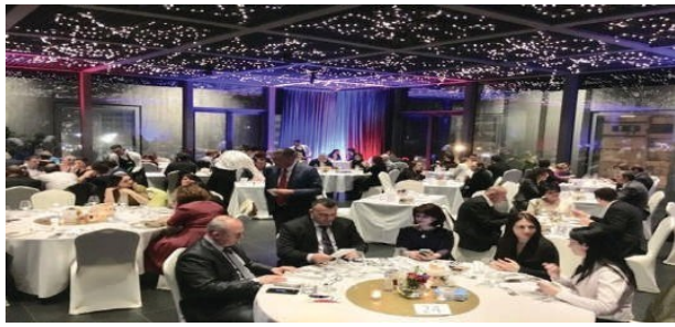
Dinner «Goût de France »