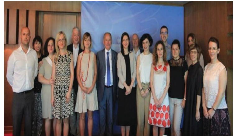
Breakfast coffee with the The Minister of Justice & with the CCI bilaterals in Albania 17/07