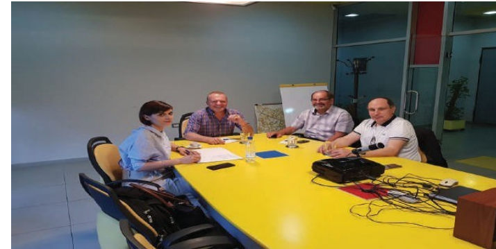
Le Comité de Tourisme -CCI France-Albanie