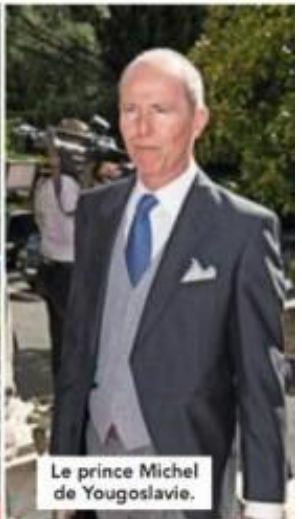
Le prince Michel de Yougoslavie.