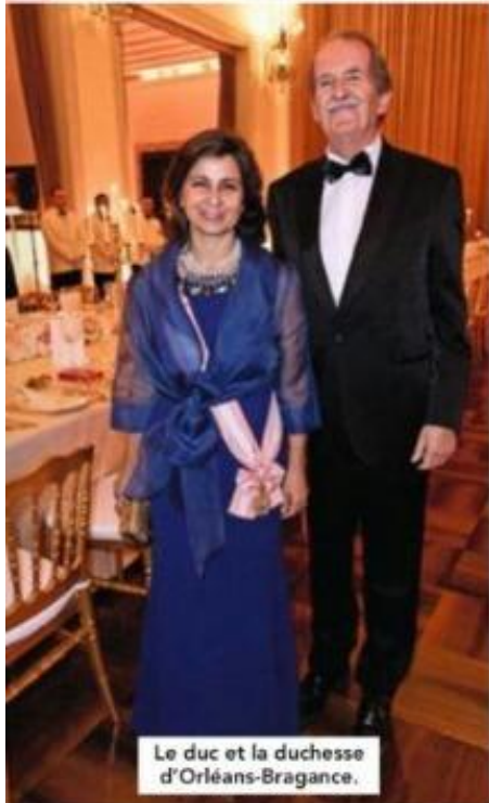
Le duc et la duchesse d'Orléans-Bragance.