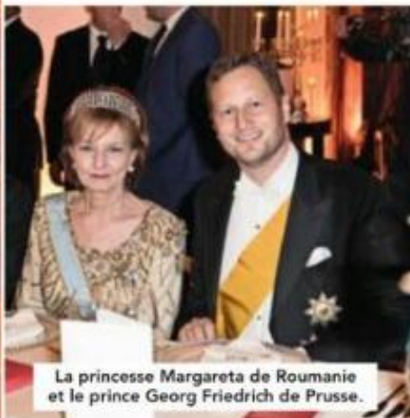
La princesse Margareta de Roumanie et le prince Georg Friedrich de Prusse.