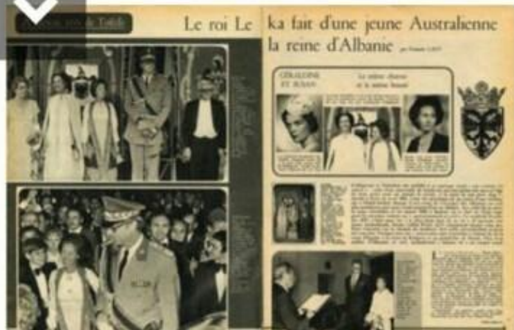
Ci-contre, Renaud Muselier, ancien ministre, député européen et président-délégué de la région Provence-Alpes-Côte d'Azur, pose avec la jeune mariée. Il est le cousin de Leka d'Albanie. En 1975, il avait assisté au mariage du père de Leka. Il avait alors 16 ans... et figurait en photo dans le numéro de Point de Vue du 17 octobre 1975 (le jeune garçon avec un nœud papillon en bas à gauche).