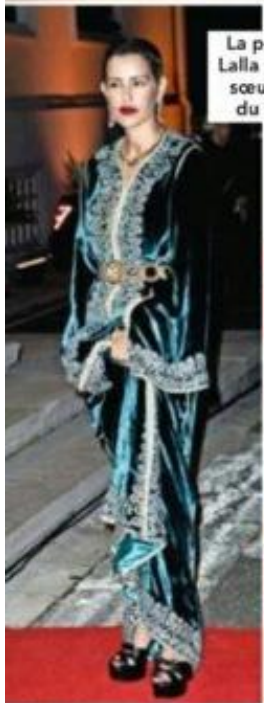
La princesse Lalla Meryem, sœur du roi du Maroc.