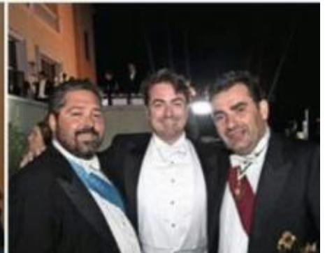
Le grand-duc Georges de Russie, le prince Joachim Murat et le prince David de Georgie.