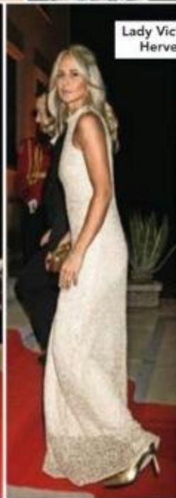
Lady Victoria Hervey.