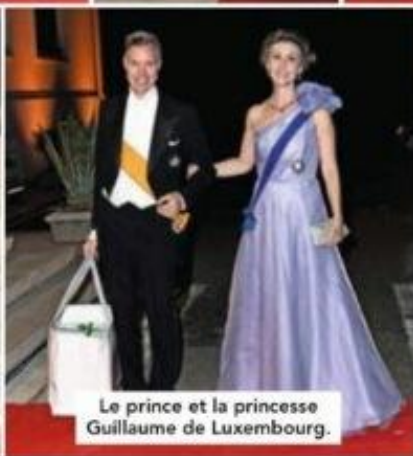
Le prince et la princesse Guillaume de Luxembourg.