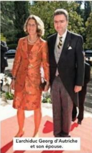
L'archiduc Georg d'Autriche et son épouse.