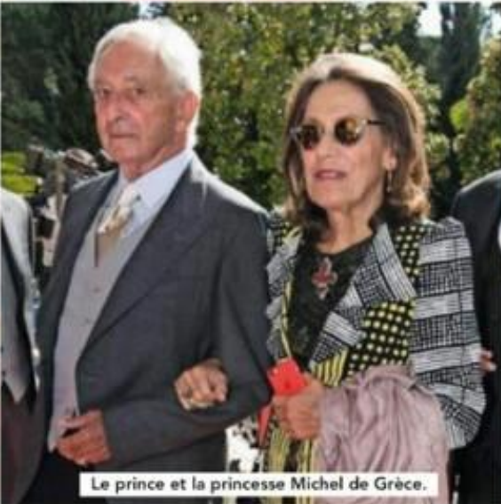
Le prince et la princesse Michel de Grèce.