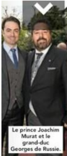
Le prince Joachim Murat et le grand-duc Georges de Russie.