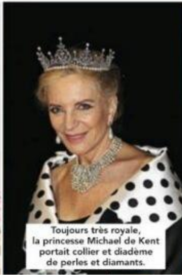
Toujours très royale, la princesse Michael de Kent portait collier et diadème de perles et diamants.