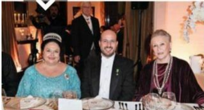
Invités au dîner de gala, la grande-duchesse Maria de Russie, le prince Mohamed Ali d'Égypte et la princesse Marie Gabrielle de Savoie.