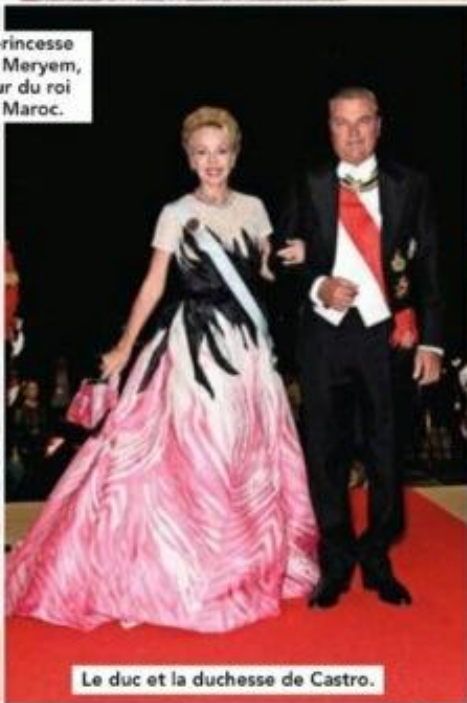
Le duc et la duchesse de Castro.