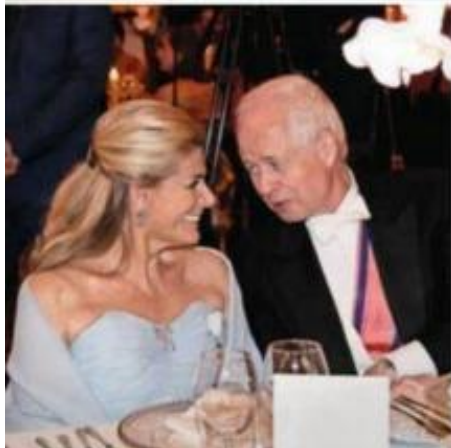
La princesse Léa de Belgique et le prince Philipp de Liechtenstein.