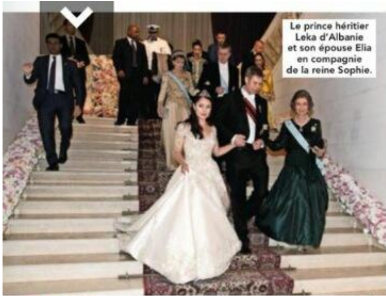
Le prince héritier Leka d'Albanie et son épouse Elia en compagnie de la reine Sophie.