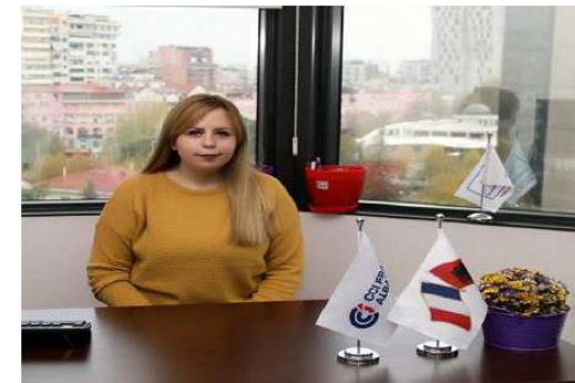
Ekipi i CCI France Albanie